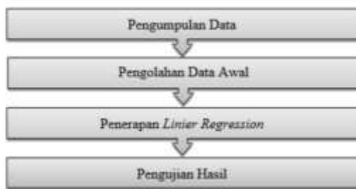
Gambar 1 . Tahap Metode Penelitian

Untuk memprediksi harga rumah adapun pendekatan penelitiannya menggunakan metode kuantitatif, lalu pada tahap metode penelitian yang akan dilakukan adalah dengan pengumpulan data dengan variable terkait, pengolahan data awal (pre-processing data), lalu melakukan penerapan dengan algoritma neural tetwork pada data, dan hasil penelitian seperti gambar 1 dibawah ini.