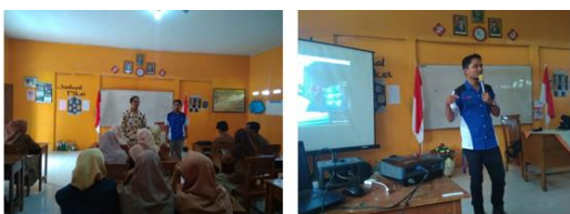
Gambar 4. Pelatihan Pembuatan Akun Google My Business dan Facebook Page

Pada pertemuan terakhir yaitu pada tanggal 25 Maret 2023 tim PKM melakukan pelatihan pembuatan akun Facebook page dan promosi pemasaran melalui platform tersebut. Mulai dari pengenalan fungsi fitur-fitur yang tersedia. Teknik pengambilan foto produk serta pembuatan video iklan produk.