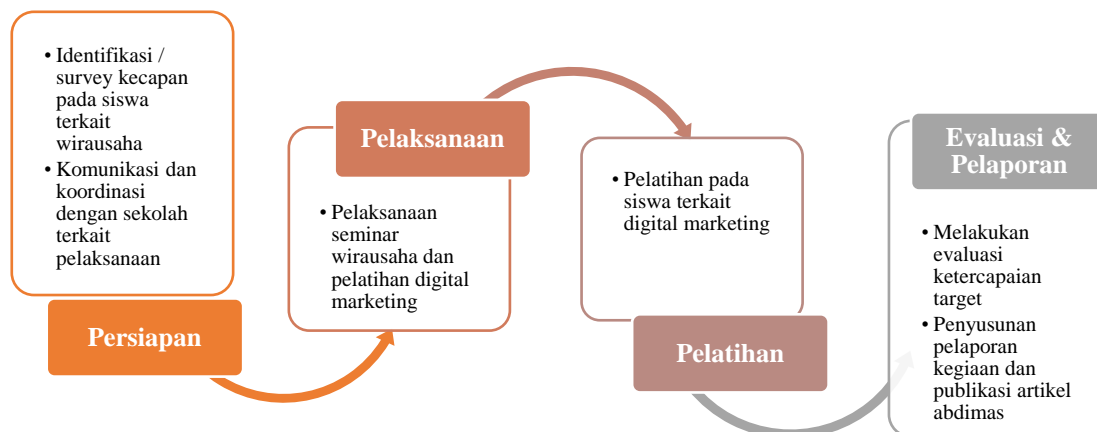
Gambar 2. Metode Pelaksanaan

Berdasarkan permasalahan yang telah dipaparkan sebelumnya dan solusi yang ditawarkan yaitu berupa pemberian pelatihan dan pendampingan terkait wirausaha. Adapun pelaksanaan kegiatan Pelatihan dan Pendampingan ini selama 3 kali pertemuan yaitu mulai dari tanggal 11,18 dan 25 Maret 2023. Tahapan-tahapan pelaksanaan pengabdian masyarakat ini dapat dilihat pada Gambar 2 :