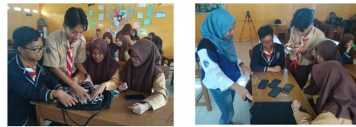
Gambar 5. Pemberian Seminar Mindset Wirausaha, Diskusi, dan Tanya Jawab Evaluasi Kegiatan

Untuk mengukur pemahaman siswa terhadap pelatihan ini dilakukan evaluasi yaitu testimoni dan penugasan pembuatan akun facebook page dan siswa melakukan promosi iklan produk melalui platform facebook page.